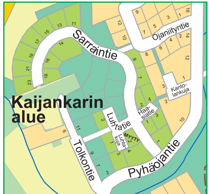
Vapaina olevat omakotitontit